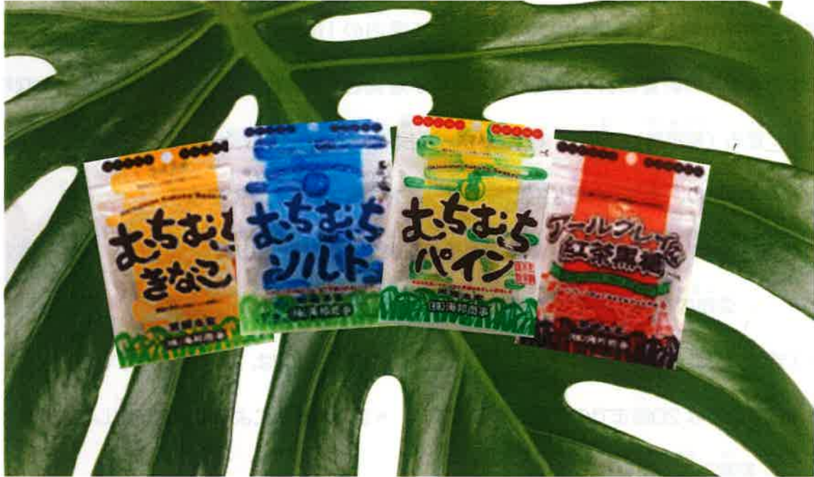
人気の黒糖セット

ぜ ひ りょうい だ よう おねが いた たしました。是非、ご利用頂けます様よろしくお願い致します。