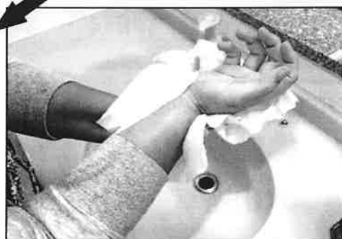
13: ペーパータオルでしっかり、ふきとります