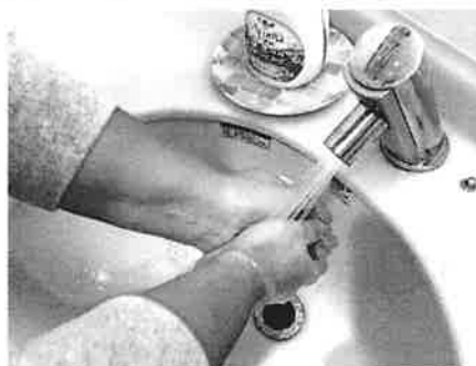
あら なが 12: しっかり洗い流す