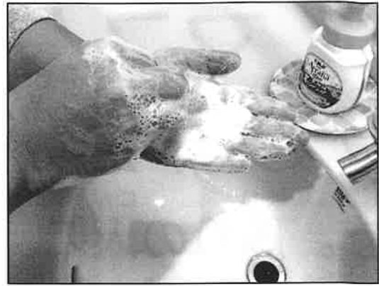
ゆびさき て ひら あら りょうて 8: 指先で手の平を洗う (両手)