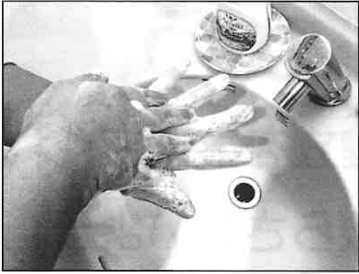
て こう あら りょうて 7: 手の甲も洗います (両手)