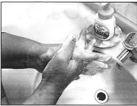
ゆび あいだ あら 9: 指の間を洗います