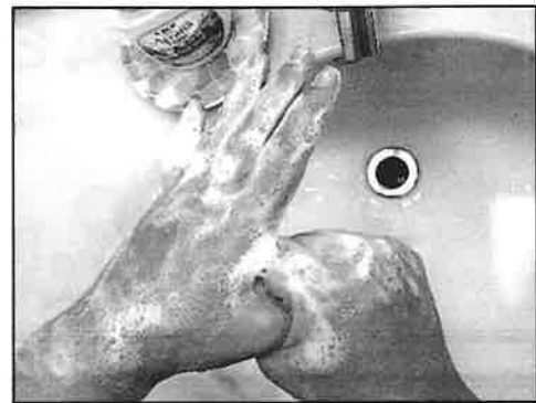
おやゆび あいだ あら りょうて 10: 親指の間をねじり洗い (両手)