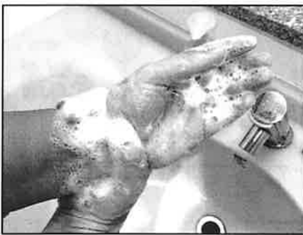
りょうてくび あら 11: 両手首を洗います