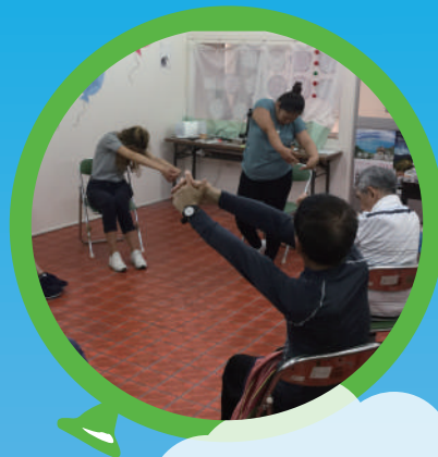
ストレッチ・ヨガ